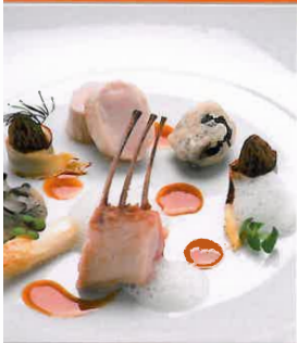
Rezepte ab Seite 26