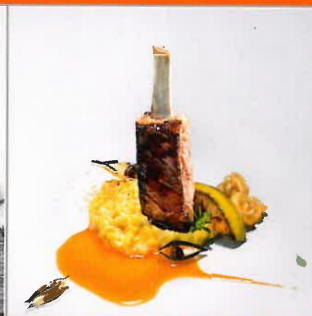
Rezepte ab Seite 62