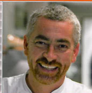
ALEX ATALA SAO PAULO