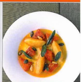
Rezepte ab Seite 74

Deutschland € 8.50 A € 9.50 | CH SFR 9.80