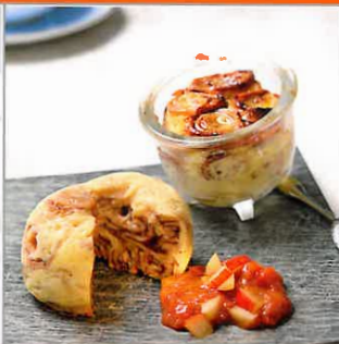
Rezepte ab Seite 38